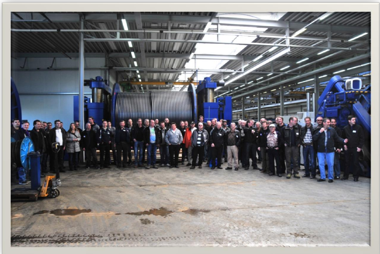
Betriebsbesichtigung Drahtseilwerk Fatzer AG Romanshorn 06.März 2015