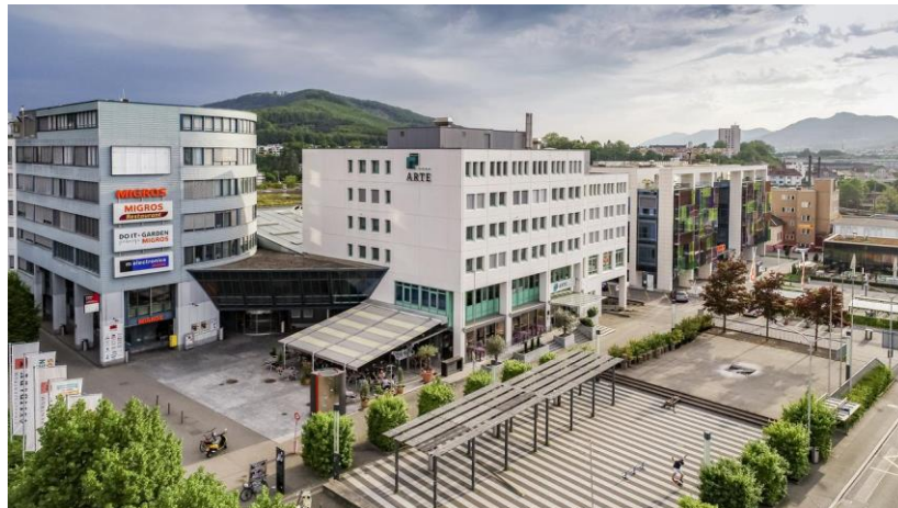
Hotel ARTE in Olten