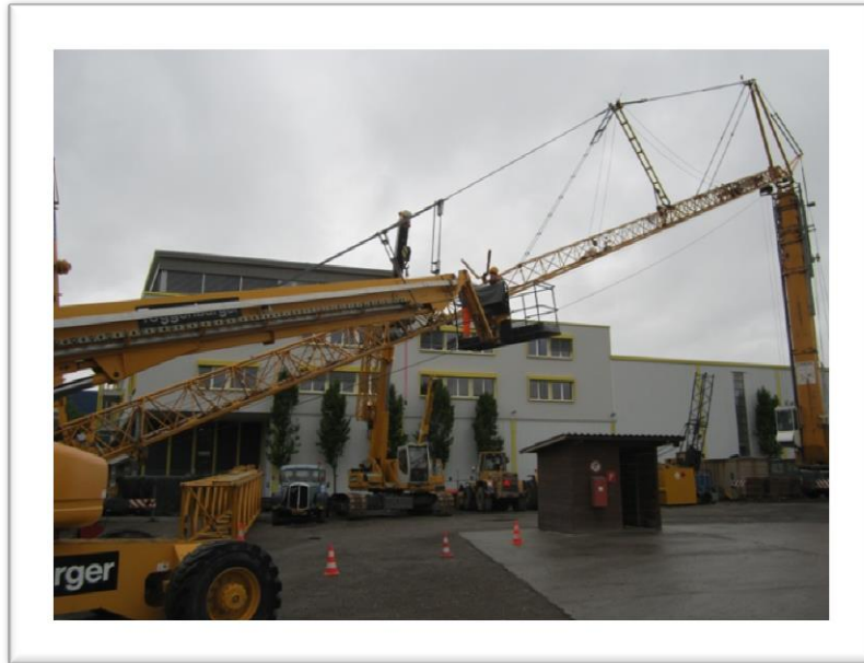
Expertenschulung Fahrzeugkrane TOBURA Winterthur 17. Mai 2013