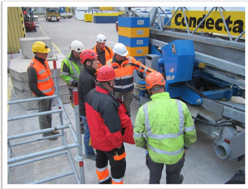
Expertenschulung Turmdrehkrane Conecta Winterthur 07. Oktober 2016